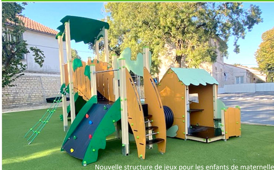
Nouvelle structure de jeux pour les enfants de maternelle